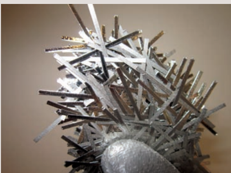
→ Fibres métalliques amorphes.