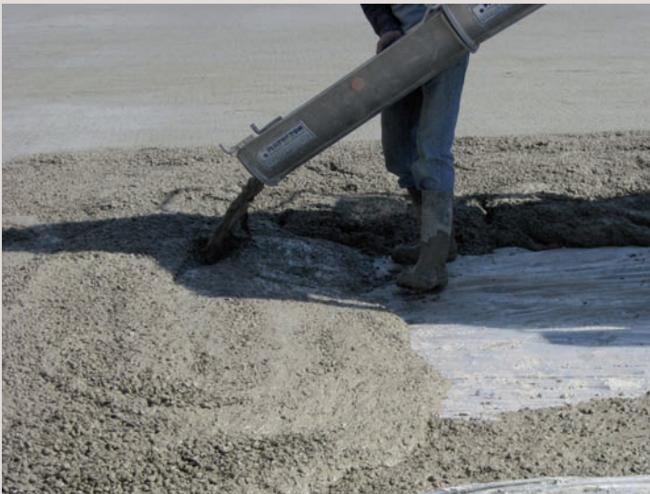
→ Déversement du béton fibré.

Les bétons fibrés peuvent être mis en œuvre par déversement à l'aide d'une benne, par pompage ou par projection sous forme de :