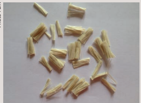
→ Fibres polypropylène.