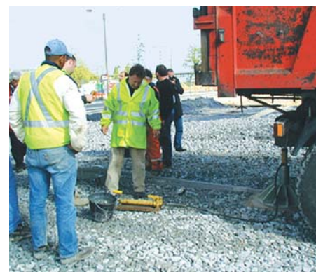
Essai à la plaque.

Hydrocyl a subi des tests de perméabilité réalisés par le LNEC (Laboratorio Nacional de Engenharia Civil, Ministério do Equipamento Social) de Lisbonne (Portugal) sur