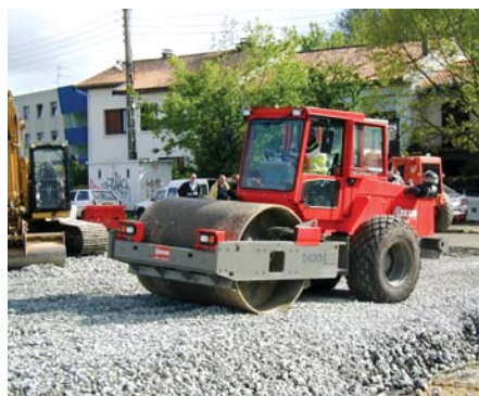
Opération de compactage.