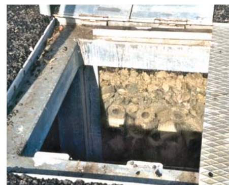
Regard de contrôle.