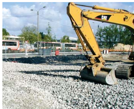
Mise en œuvre à la pelle mécanique.