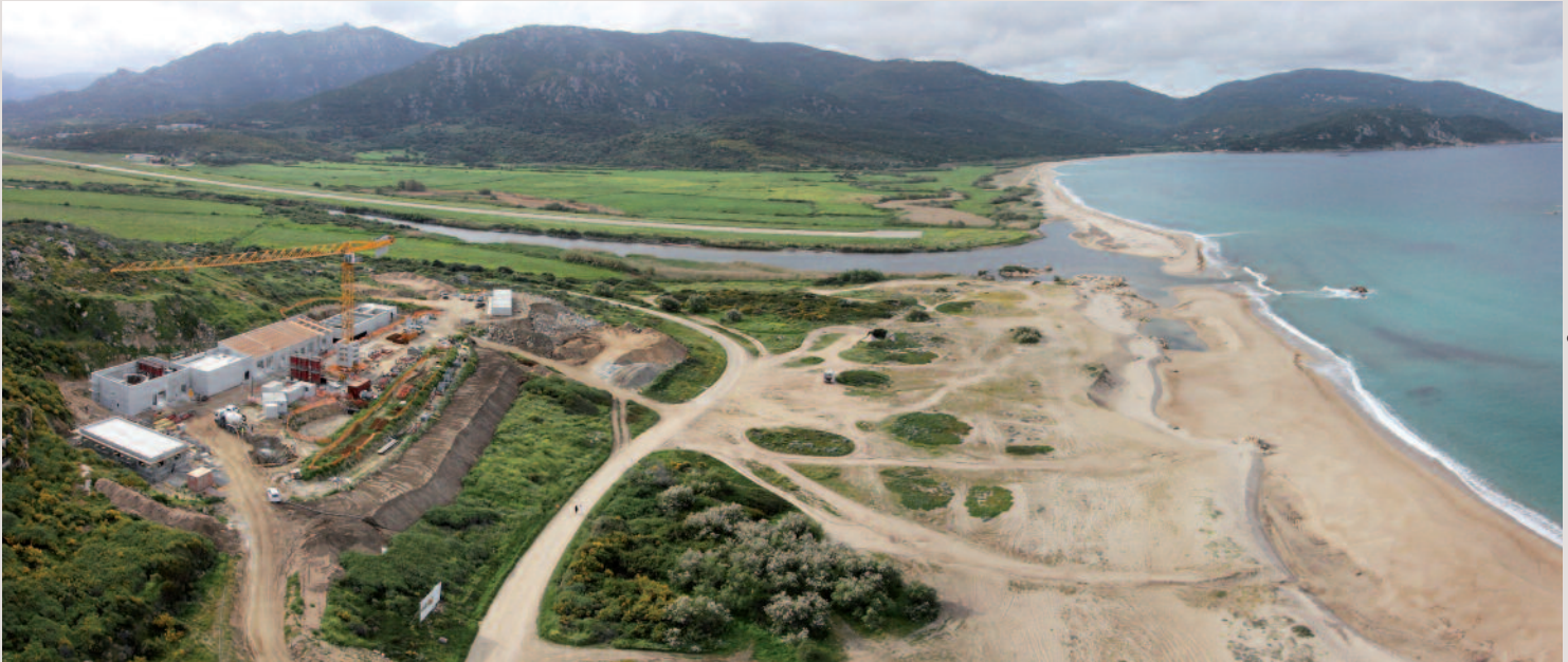
→ Station d'épuration de Capo Lauroso, golfe de Propriano : la perception visuelle de l'équipement est réduite et vient se glisser dans le site.