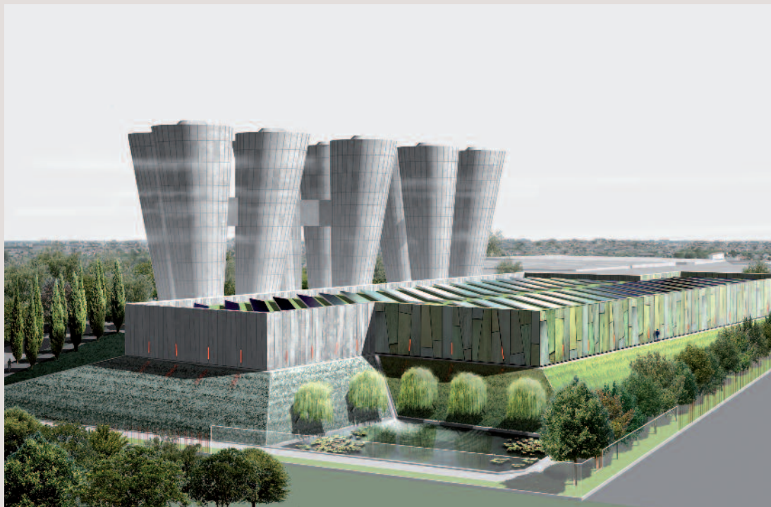
Morphing de synthèse : Lelli Architectes, Dominique & Giovanni Lelli

Le réseau d'eau potable distribue chaque année entre 5 et 6 milliards de m 3 . 70 % des services publics d'eau potable sont gérés directement par la collectivité compétente. Cependant, en termes de population, le rapport s'inverse puisque près de 60 % de la population française est desservie par un délégataire.